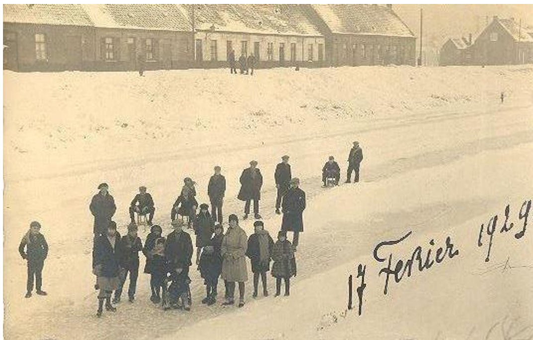
90 jaar geleden lag het Schipdonkkanaal in Deinze toegevroren.

Onze tentoonstelling HET SCHIPDONKKANAAL TUSSEN DEINZE EN MERENDREE zal tijdelijk verdwijnen uit de expositiepoort van het Gentiel De Smethuis in de Tolpoortstraat 79. De Kerstman zal er tijdelijk zijn opwachting maken. Na Kerstmis zal ze opnieuw te bezichtigen zijn.